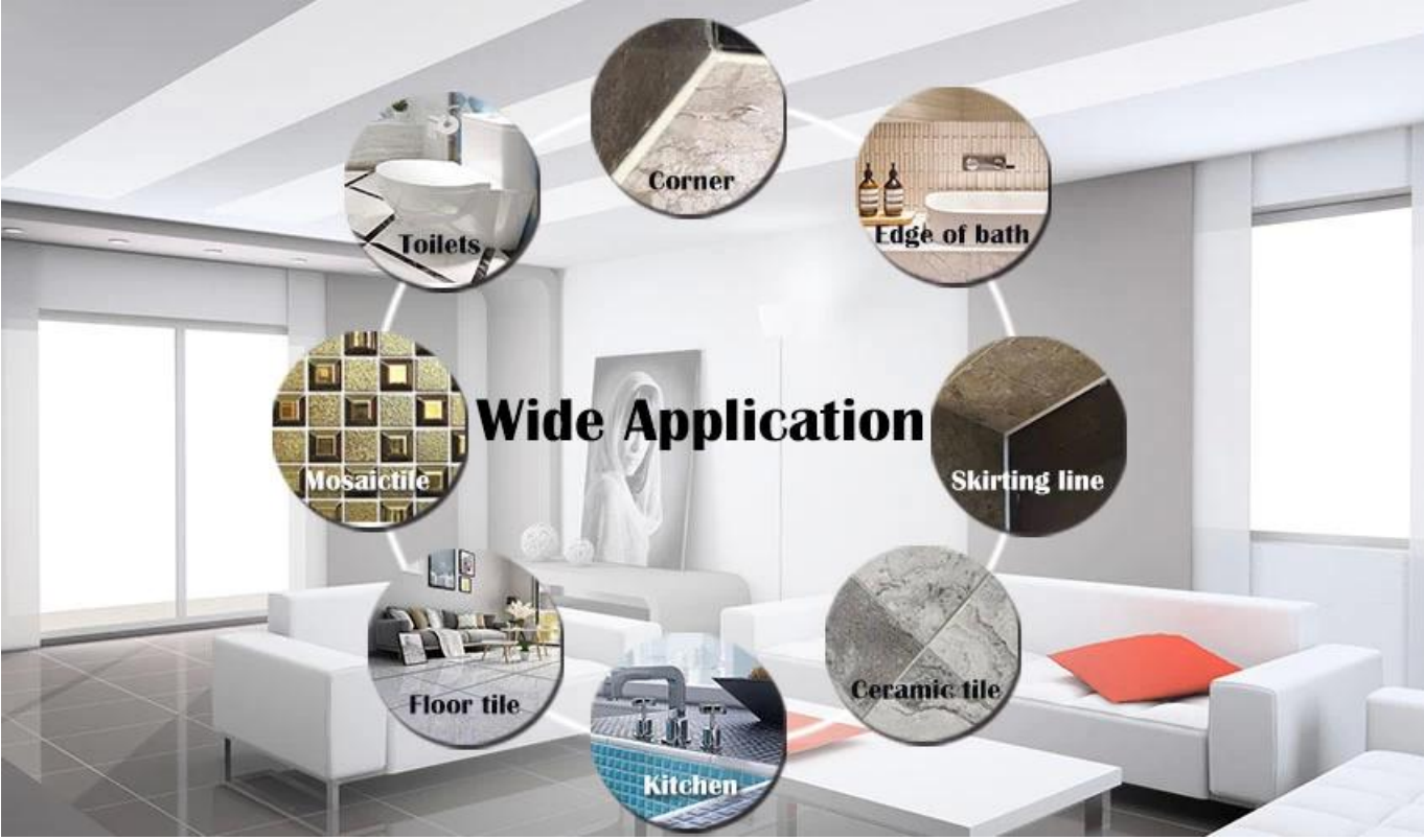
此 圖 展示了 epoxy grout 之 廣泛 應用 範圍， 包括 浴室、 廚房、 客廳 及 辦公室 等 各種 環境。

epoxy grout 係 一種 無 收縮 之 填縫 劑， 係 由 環氧 樹脂 及 矽 膠 等 材料 組成， 其 優點 係 堅固 耐用， 且 能 防止 水 滲 透 及 黴菌 生長， 故 常用 於 浴室 及 廚房 等 潮濕 環境。 此外， epoxy grout 亦 具有 高 黏性， 能 緊密 黏合 磚 塊， 防止 鬆動 及 脫落。 其 缺點 係 施工 較為 複雜， 且 價格 較高。 總 之， epoxy grout 係 一種 優質 之 填縫 劑， 適合 用於 高 要求 之 環境。 decolorizing 係 指 填縫 劑 變色 之 現象， 可能 由於 填縫 劑 質素 不佳 或 施工 不當 所致。 為 防止 此 類 問題 發生， 建議 選用 優質 之 填縫 劑， 並 注意 施工 方法。 cluing 係 指 填縫 劑 變色 之 現象， 可能 由於 填縫 劑 質素 不佳 或 施工 不當 所致。 為 防止 此 類 問題 發生， 建議 選用 優質 之 填縫 劑， 並 注意 施工 方法。 grout 係 指 填縫 劑 之 總稱， 常用 於 磚 塊 之間 之 填縫。