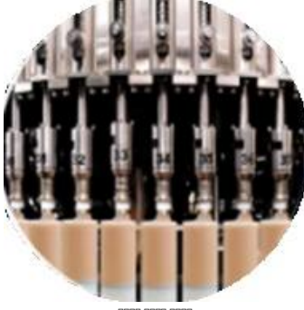
XXXX XXXX XXXX