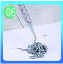
Forepart 60-80 grout