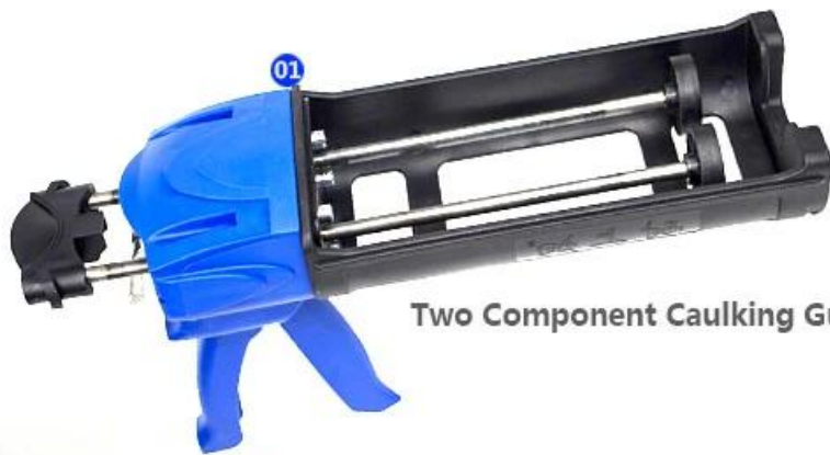
Two Component Caulking Gun