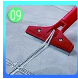
4-5 grout float