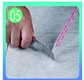
將填縫劑填入磚縫中，並用填縫浮子將填縫劑壓入磚縫中。