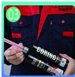
將填縫劑填入磚縫中，並用擠出式填縫劑管將填縫劑壓入磚縫中。