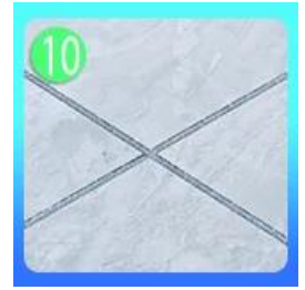
24 grout float